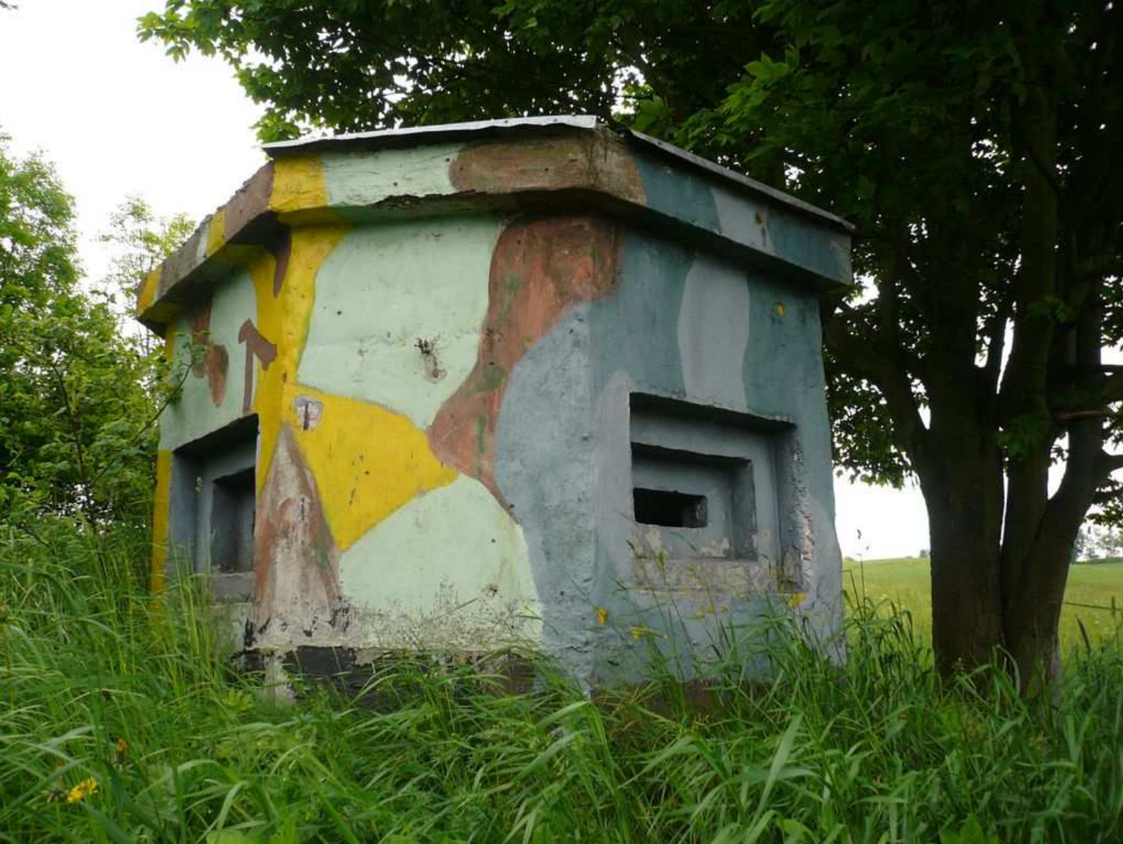
Oktogonální pozorovatelna Civilní obrany nad Náchodem.