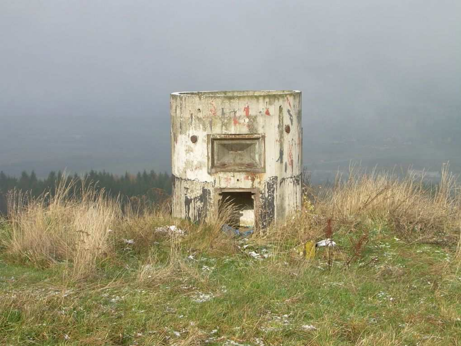
Válcová pozorovatelna Civilní obrany v lokalitě Sokolov-Novina.